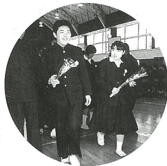
花束を手に退場する卒業生(中学校)

を胸に、自分達の夢や希望に向かって新たな世界に旅立ちました。また、3月17日には町内各小学校の卒業式が行われ、124人が思い出っばいの学舎から巣立ちました。