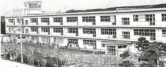
平成13年度から建設が予定されている中学校校舎