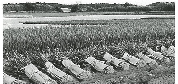
町特産の秋冬ネギ