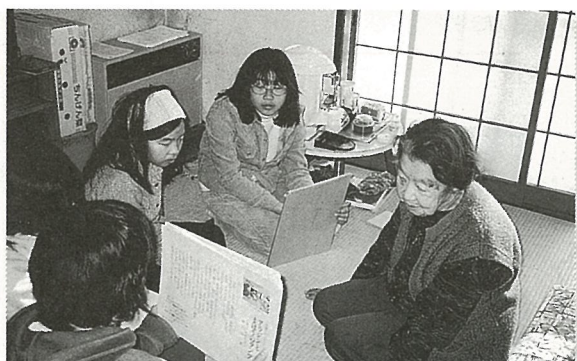
紙芝居を読んでもくれる子供たちをやさしい目で見守ります

2月15日、日吉小5年生は、光楽園老人ホームでボランティアスクールを体験しました。昨年引き続き今年で2回目の訪問ということで、子供たちはその日を楽しみに準備を進めました。ほとんどの子供たちは、お年寄りの顔を覚えていたので打解けるのにも時間はかかりません。カルタ・紙芝居・双六で遊んだり、写真を撮ったりと楽しい時間を過ごしました。 また当日は、北風が強く雪もちらつく寒い日でしたが、一緒に買物した材料を使って料理した鍋を囲み体も暖まりました。 最後に手芸で犬作りを一緒に楽しみ、帰る子供たちの手には、かわいいおみやげができました。 お年寄りとの交流を深め子供たちには有意義な1日となりました。