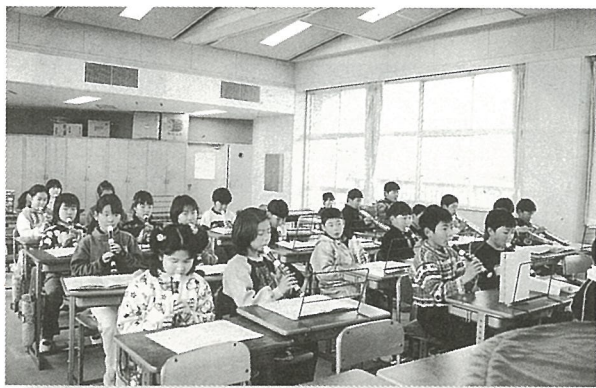
防音工事が終了した静かな教室で授業を受ける児童 (白浜小学校)

改造防音校舎は、騒音防止対策や各教室ごとに温度調整が出来る空調設備も設置されています。子どもたちに、今度の校舎の感想を聞いてみると、「暖かくて、とてもうれしい。」と、先生方からは、「快適な環境で学習ができるようになりました。」という声がかえってきました。平成12年度には、日吉小学校と東陽小学校の改造防音工事が予定されています。