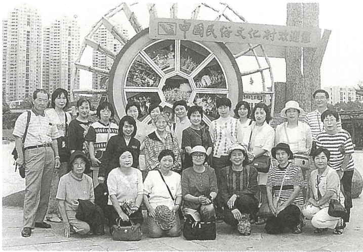
中国民俗文化村で

平成2年度から10年計画で実施された「女性の海外視察研修」は今回で最終回を迎えました。