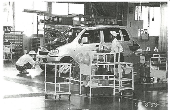
付属部品の取付も行われます