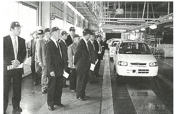
流れ作業で整備されます