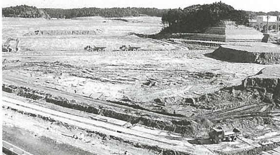
造成が進むひかり工業団地