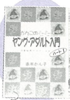
赤木かん子氏の著作本