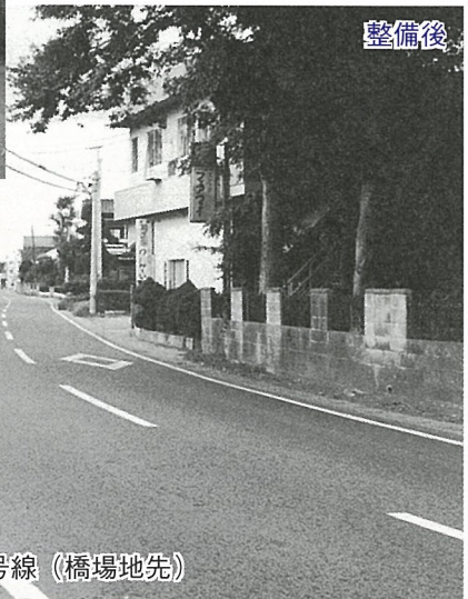
整備された町道0107号線 (橋場地先)

また、町縦貫道である町道0106号線(スクールライン)で1090mの道路改良工事を行いました。 その他に、町道0101号線(篠本・130m)、町道0102号線(傍示戸・176m)で道路改良し、町道0104号線(母子・540m)で舗装修繕を行いました。