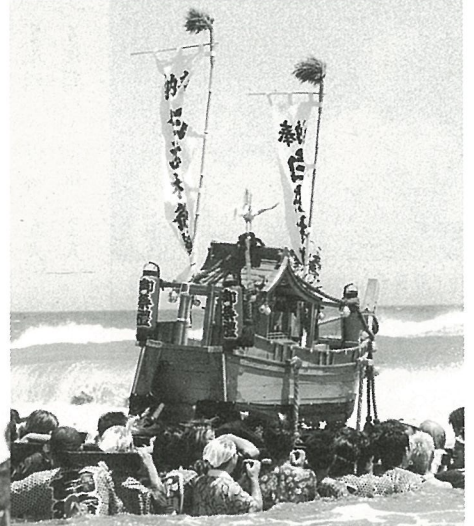
▲荒波に向かって船みこしを担ぎます