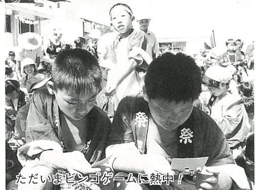
ただいまビンゴゲームに熱中！