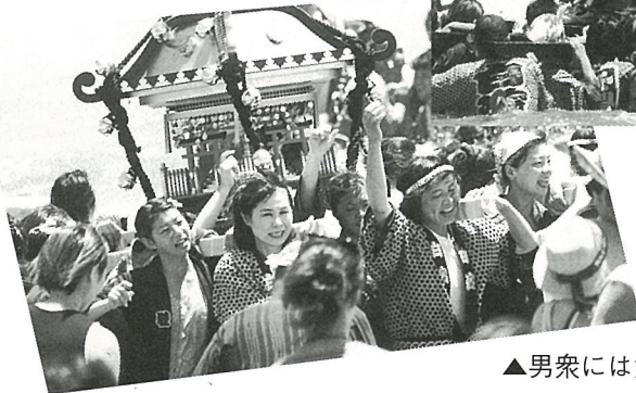
▲男衆には負けません