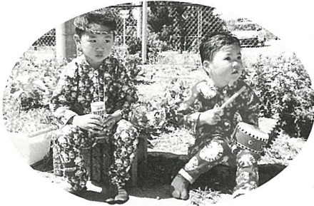
▲こんなかわいい姿もみられました 休憩に、たいこの練習？