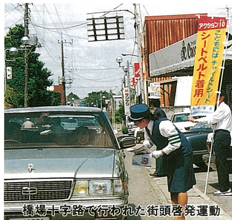
橋場十字路で行われた街頭啓発運動

好天に恵まれた5月30日、早朝から協力をいただきました「ゴミゼロ運動」は、町内全域で行われ、6・2トンのゴミが集められました。 みなさんも観光地などにかけたときは、自分が出した空き缶や紙屑などのごみは必ず持ち帰りましょう。 今後も、この運動を通して環境美化の意識向上を図るとともに、「美しいふるさとづくり運動」を推進していきます。