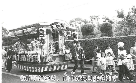
お囃子にのり、山車が練り歩きます