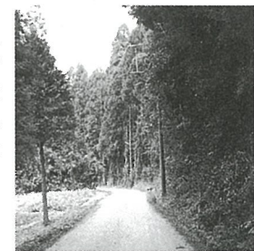
きれいになった篠本1区の集落内道路

10月25日、篠本1区で道路美化活動が行われました。この日、区民総出で町道の草刈りや側溝の掃除、木の伐採などをしました。この美化活動は、篠本1区のみなさんが自主的に行ったものです。