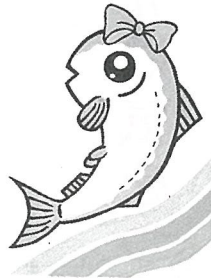
栗山川 川づくり ロゴマーク

栗山川では、平成9年7月にふるさとの川整備事業が建設省から認定され、「できることから始めよう、みんなでつくる栗山川」を合言葉に、住民参加の親しみやすい川づくりを目指しています。