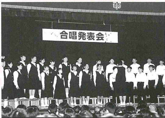
日頃の練習成果を披露