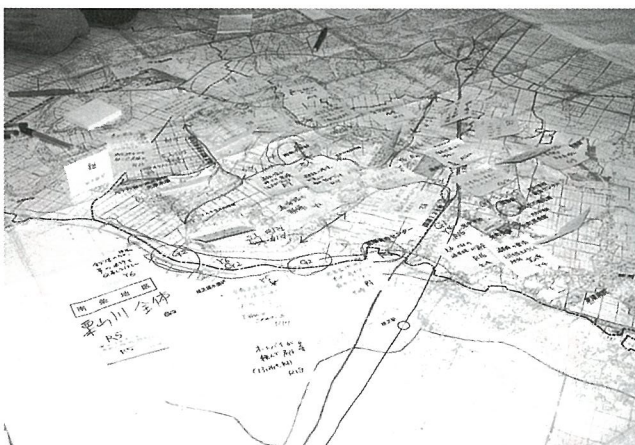
▲貼り出されたカード

第1回目の懇談会は、地図の上に町の良い点、悪い点、将来の夢や希望を書いたカードを貼っていくというユニークな方法で進められました。