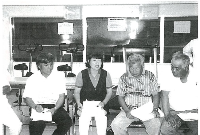
▲女性も女性の立場で積極的に意見を述べています。

このカードを種類別に分類・整理し、今後のまちづくりにどのように活かしていけるかを検討していきます。