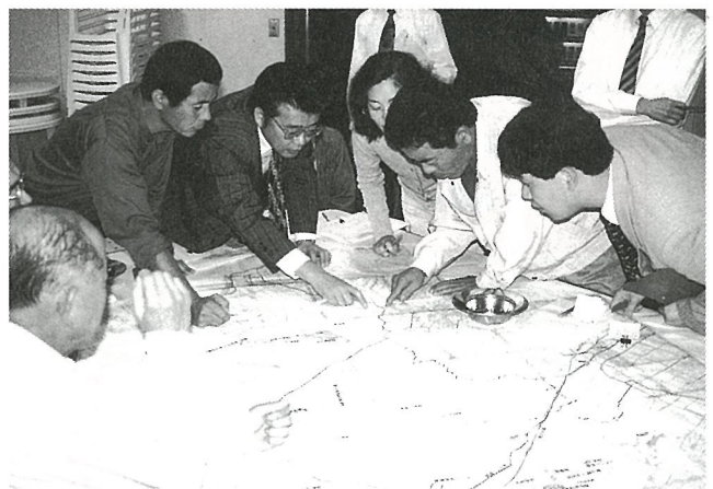
▲みんなで地図を囲んで場所探し

これらの意見を反映しながら、今後の懇談会では、地域の将来像について検討していききたいと思います。