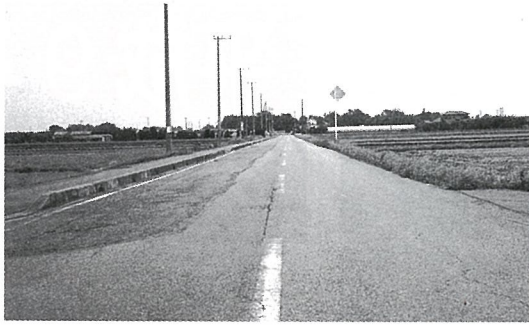
今年度整備を予定している町道0106号線（スクールライン）

直営舗装では、みなさんからの要望にできるだけ応えられよう245万円を増額しました。また、平成8年度から計画的に実施している町道0106号線（スクールライン）道路改良工事について、今年度の当初予算では宮内地先から作間内地先までの510mを予定していましたが、事業の早期完了を図るため、工事区間を作間内地先から篠原地先まで300mを延長する事業費を増額しました。