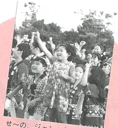
せ〜の、ジャン・ケン・ポン