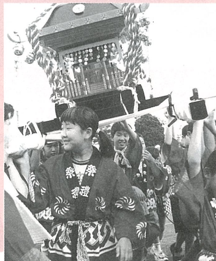
こどもみこし 「ワッショイ、ワッショイ」