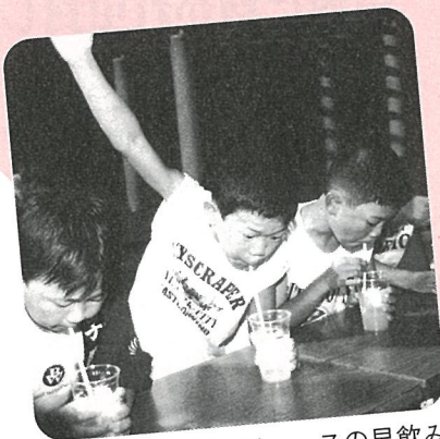
ジュースの早飲み 「ぼくが一番!」