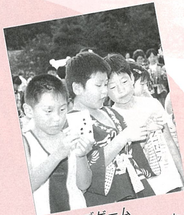
ビンゴゲーム リーチはまだかな?