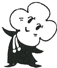
ねんきんななちゃん