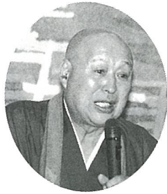
豊富な話題 無着氏