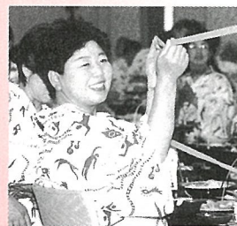
歌と踊りで盛り上がります