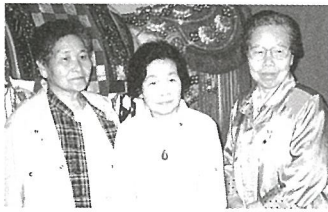
友人と一緒に「写真左」

雨の出発となった北東北の旅行だったが、青森空港に着いた時は雨も降らず、まずまずのスタートだった。特に今回の旅行の中で奥入瀬溪流散策は若葉のみどりと、清らかな水の流れるに普段の生活の中では感じることのできない、何かを感じました。 友人と一緒に参加したこ