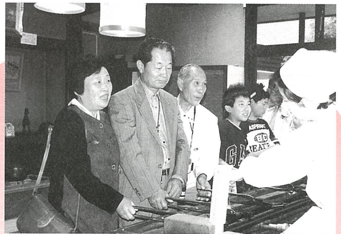
「このくらいでいいかしら」南部せんべい手焼き体験

の旅が、第11回目、私の申込み順が偶然にも11番目ということで、みなさんの前で記念品を頂きました。 私も今年77才、健康に気をつけて、来年も参加したいと思います。本当に、ありがとうございます。