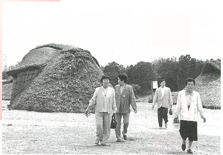
縄文時代の巨大集落・三内丸山遺跡を見学