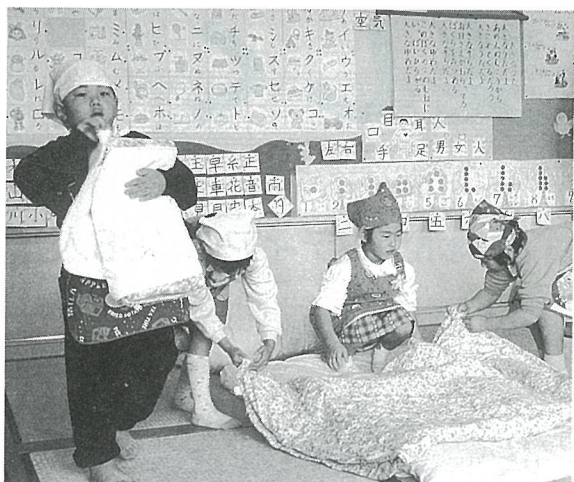
1年生の授業では、「いえで、ほくにわたしにできること」として、ふとんのかたづけを行いました。