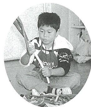
↑ 育ったよ、2年生はネギの皮むきを体験。

10月19日、木更津市かずさアカデミアパークで健康・体力フェスティバル「げんきフェスタ'97」が開催され、その中で南条小学校が、なのはな体操優良学校団体として表彰されました。 この表彰は、年間を通して業間活動の際に準備運動として「なのはな体操」に全校で取り組んだ実践が認められたものです。