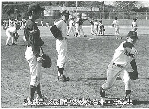
熱心に実技指導を受ける小・中学生