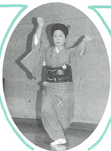
艶やかな姿で舞踊発表

また、地元の新鮮野菜の即売や米の無料つかみどり、もち、牛の丸焼き、トン汁のサービスコーナーが人気を呼び、収穫の秋を祝う多彩な催しで大盛況でした。