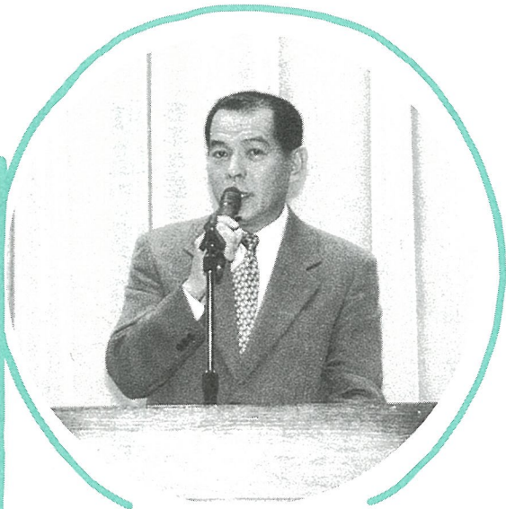
芸能界で大活躍の地井武男さん テレビ番組収録の裏側など 俳優人生を楽しく話されました。

秋恒例の産業まつり、文化祭が11月22・23日の2日間行われ、子供からお年寄りまで4万8千人の人で賑わいました。