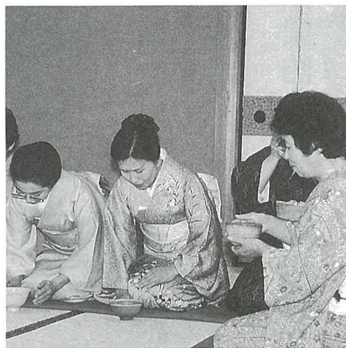
心静かに、けっこうなおてまえでした