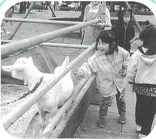
ヤギと仲良く！ ミニ牧場には、子ぶた、うさぎ、ポニー等 動物がいっぱい