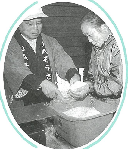
手が小さくて 新品種「ふさおとめ」のつかみどり