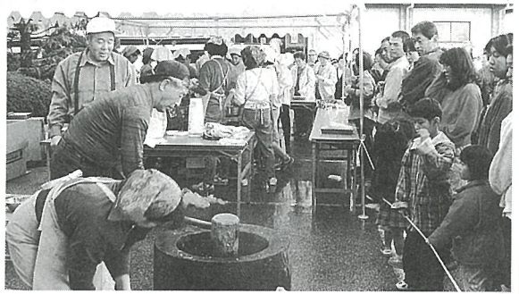
つきたてのおもちは、おいしいよ