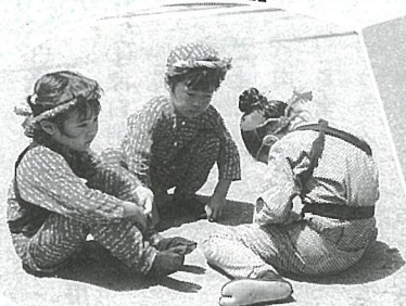
疲れたのでちょっと休憩……