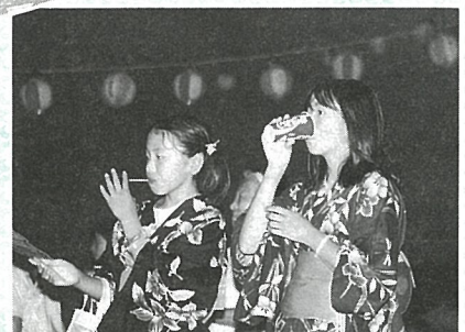
ゆかた姿が ステキな2人