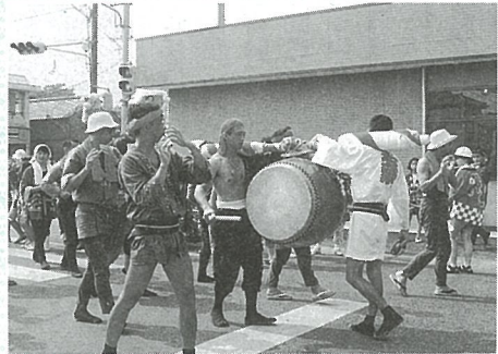
男気あふれる「はやし連」