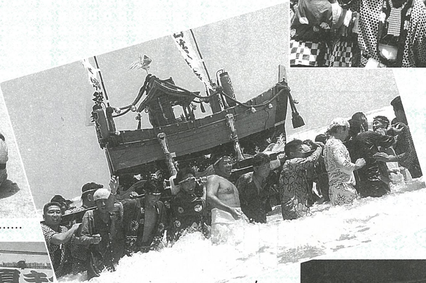
300Kの船みこし、太平洋に挑む!