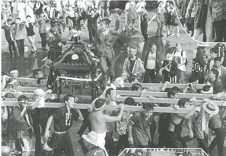
東陽まつりは、みこし一色