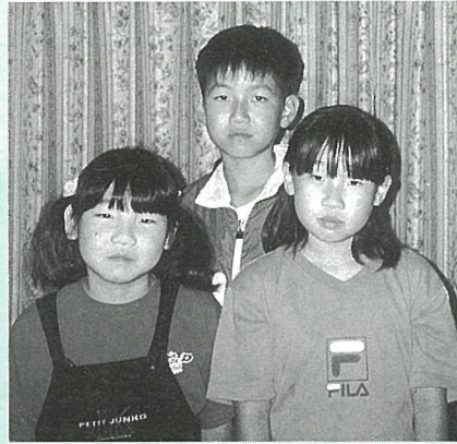
お父さんの車椅子を押し、健康の大切さを学んだ3人

毎日ささいな事で喧嘩はしてないだろうか、宿題は忘れてないか等心配はつきませんでした。それにしても今さらに思うのは、親がなくても子は育つとはよく言ったもので、私は子供から教わる