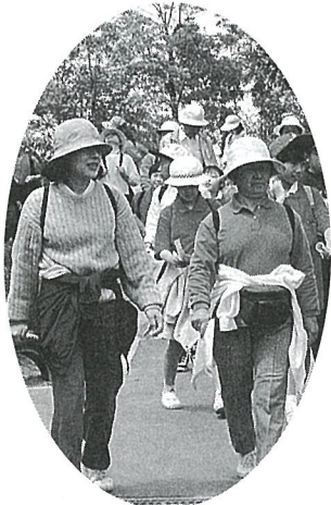
昨年の健康ウォーク