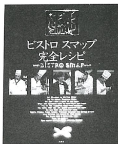
★「ピストロスマップ 完全レシピ」 扶桑社

「……たった一度の人生だから」 この人を永遠に自分のなかにとどめておきたい。男と女の性愛の真髄を描き、日本経済新聞連載中から圧倒的な反響をまき起こした注目の長編。