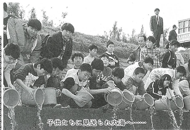
子供たちに見送られ大海へ……