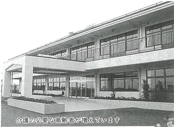
介護の必要な高齢者が増えています