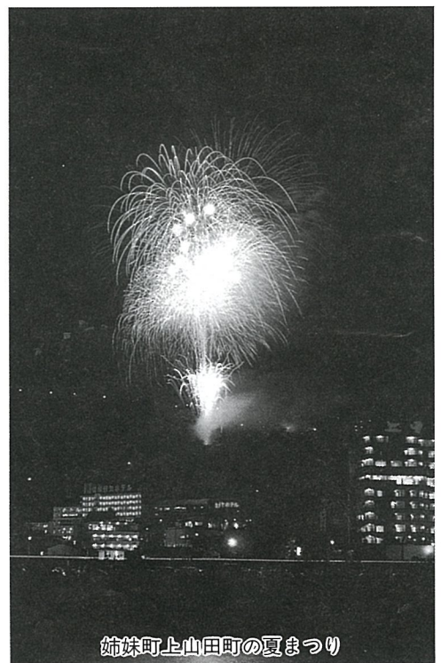
姉妹町上山田町の夏まつり

災害対策事業 大規模災害時の生活用水確保のため集水複合井戸を町内2か所に設置します。 また、計画的に整備している災害用備蓄品の購入に係る今年度の予算額は424万9千円です。