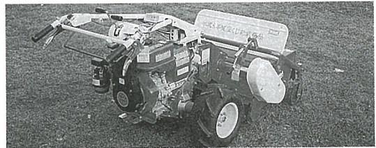
作業の能率化が図れます。除草機械