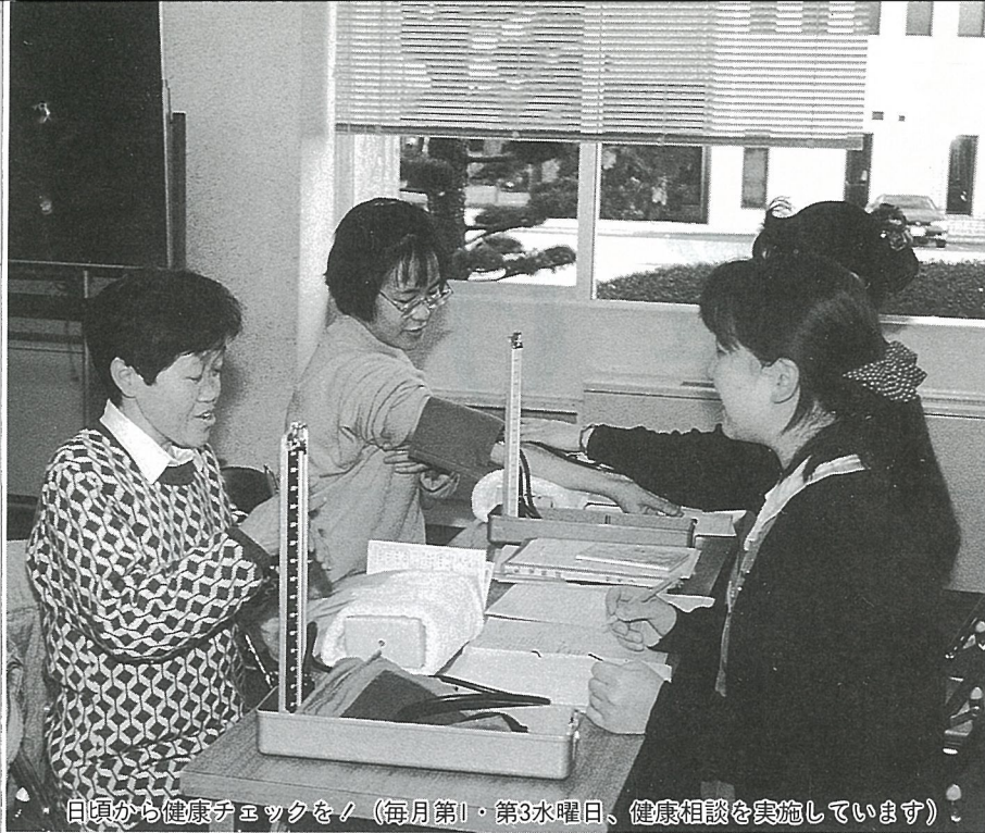
日頃から健康チェックを！(毎月第1・第3水曜日、健康相談を実施しています)

人口の急速な高齢化並びに医療技術の高度化や疾病構造の複雑化、受診率の上昇等により医療費が急激に増えています。光町の国保財政はここ数年医療費の著しい伸びに、国保税収入が追いつかない状況にあり、赤字巾が年々大きくなろうとしています。