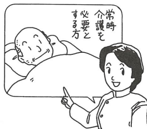
常時介護を必要とする方

短期入所(ショートステイ) 介護者の病気、冠婚葬祭、行事等で短期間介護を受けられない場合 ☆概ね65歳以上で入所要件に適合している方を一時的に養護し、その間日常生活に必要なサービスを提供します。