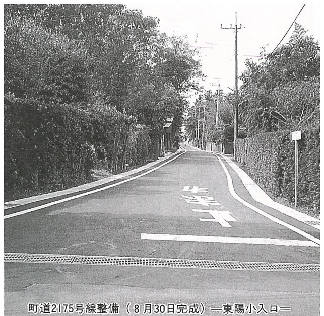
町道2175号線整備（8月30日完成）＝東陽小入口＝