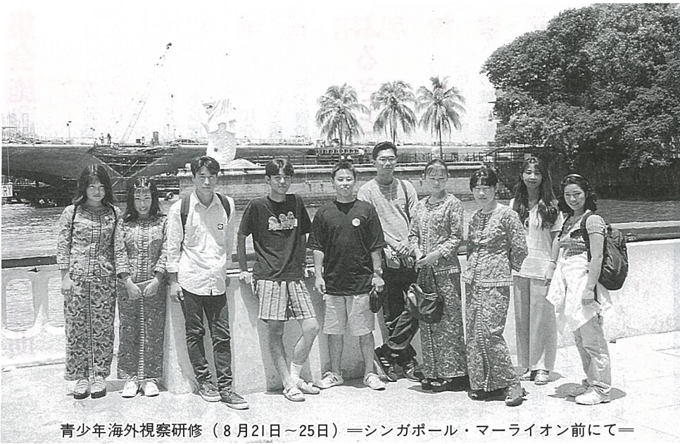
青少年海外視察研修（8月21日～25日）＝シンガポール・マーライオン前にて＝

特定財源は、その使い道が指定されており、指定された事業が終わらなければ収入できないのがほとんどです。このため、収入の時期は年度末になることが多く、上半期の収入率が低くなるのはこのためです。