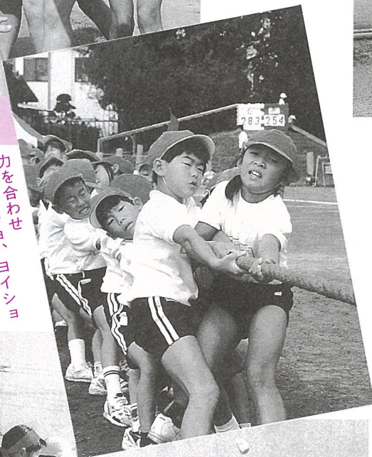
力を合わせ ヨイシヨ、ヨイシヨ % (白浜小)