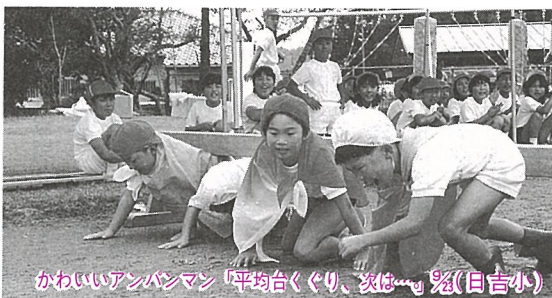
かわいいアンパンマン「平均台ぐり、夜は夢」% (目吉小)