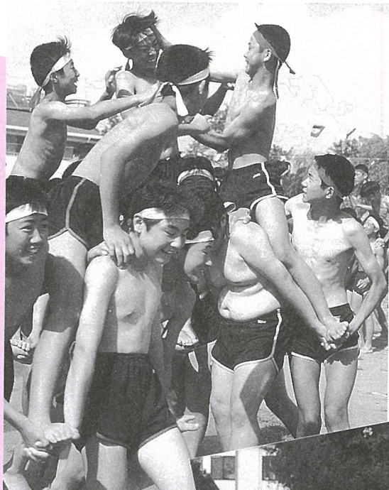
カとカのぶつかり合い (光中)

9月8日、中学校の体育祭を皮切りに、町内の各小学校で秋季大運動会が行われました。 台風のため延期された各小学校の運動会では、この日を心待ちにしていた子供たちが、お父さんやお母さんの声援を受け、走ったり飛んだり全力で頑張っていました。