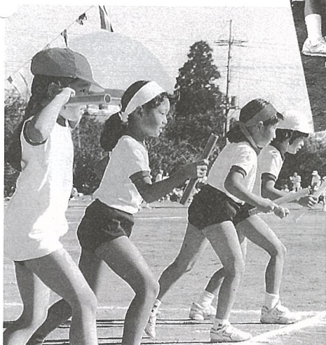
ヨーイ、こわいなーピストル! % (東陽小)