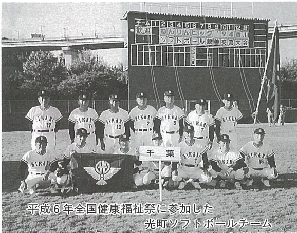
平成16年全国健康福祉祭に参加した 光町ソフトボールチーム