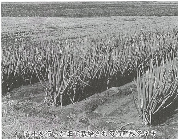
客土を行った畑で栽培される特産秋冬ネギ