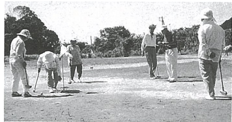
▲グラウンドゴルフで楽しいひととき