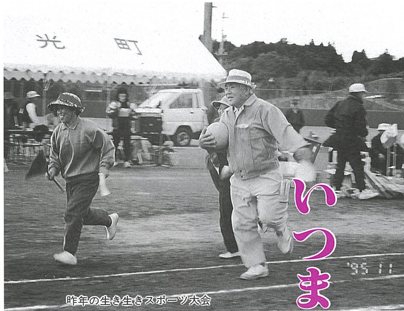
昨年の生き生きスポーツ大会