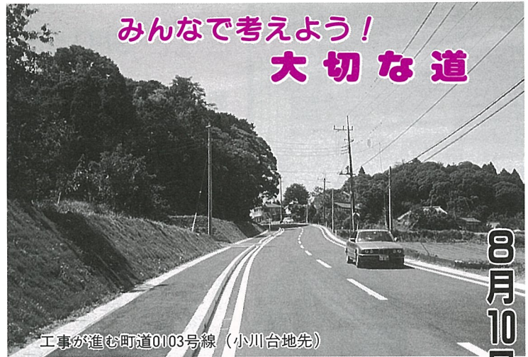
工事が進む町道0103号線（小川台地先）