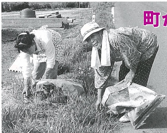
▲あいかわらず多いポイ捨ての空き缶