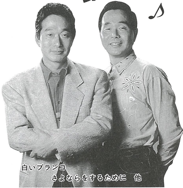
白いブランコ さよならをするために 他