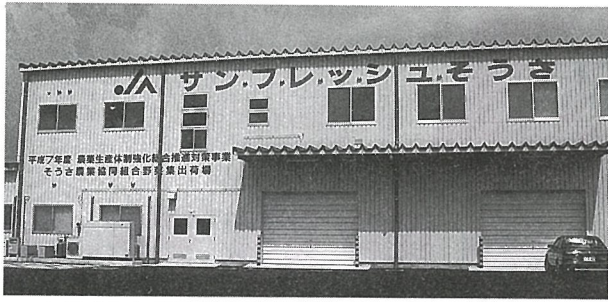
▲完成した野菜集出荷場

消費者には、より新鮮な野菜が供給され、生産者には、野菜の安定出荷・省力化がはかられ、規模拡大が可能になるものと期待されています。