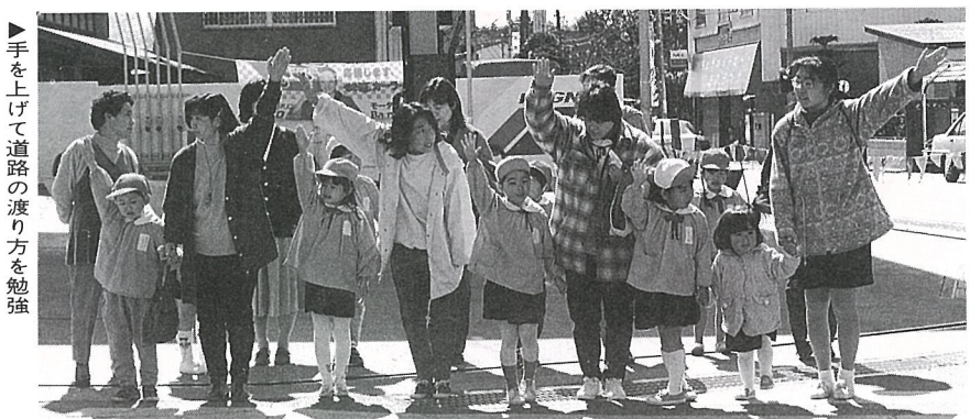
▶手を上げて道路の渡り方を勉強 (中央保育園・幼稚園)

園児や児童がいる家庭で は子供の飛び出し事故を防 ぐため、通学路や家の周り を子供と一緒に歩き、安全 な歩き方や道路の横断の仕 方、信号の意味と見方など を教えましょう。このとき 子供の目線で風景を見てく ださい。大人の目線では気 がつかなかったことが発見 できます。また、身近に起