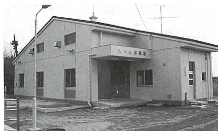
今年度中に稼働を始める木戸排水機場

農業近代化施設整備事業 404万円 ライスセンターが農業用機械を整備する場合、その経費の一部を補助します。今年度は、6か所が補助対象です。