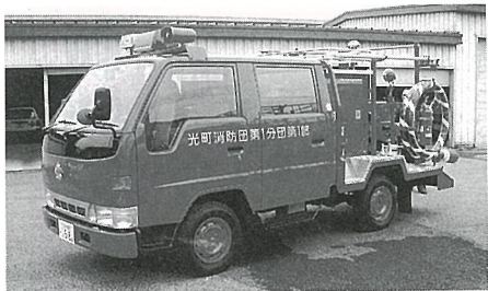
消防自動車を購入（写真は昨年度更新車両）