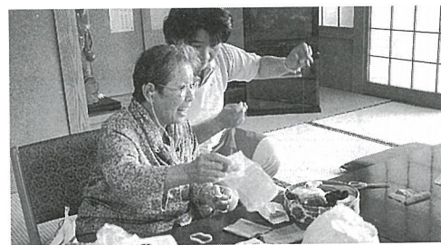
デイサービスで楽しみながらリハビリ

防災施設の整備 1308万円 消防自動車購入 16年を経過した小型動力ポンプ付積載車（小川台・篠原・宮内）と小型動力ポンプ積載車（五之神）を更新します。 アマチュア無線受信機購入 災害時の通信手段確保のためアマチュア無線受信機を2台購入します。今後、計画的に増設します。