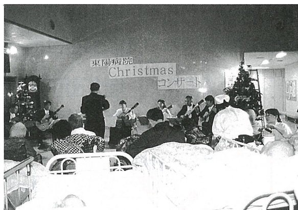
▲ 150人の人でホールはいっぱいになりました

12月25日、東陽病院で入院中のみなさんに音楽を楽しんでもらおうと、クリスマスコンサートが開かれました。職員が真赤なサンタに扮しクリスマス気分いっぱい。ツリーが飾られたホールは、入院中の患者さんや付添いの人たちでいっぱいになりました。 この夜、クラシックバンドのセピアのメンバーにより「ジングルベル」や「影をしながら」等12曲が演奏され、クリスマスソングの「きよしこの夜」を全員で合唱しました。 この音楽の心暖まるプレゼントに、会場から大きな拍手が送られていました。