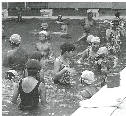
水温30℃、温水プールで真夏の気分

年末年始の疲れを、プールでふきとばそう! 海洋センターでは、1月5日(金)プールを無料開放します。当日は甘酒のサービスもありますので、是非おいでください。