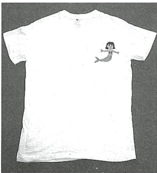
『シルクスクリーン』 自分のシンボルマーク