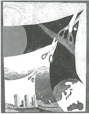
『不思議な世界 小さな文明』