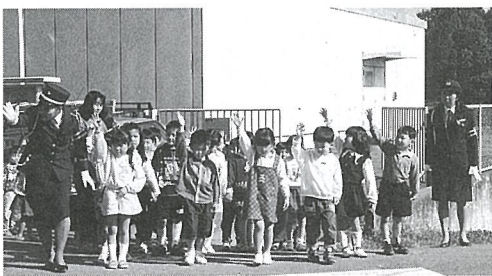
▲手を上げて道路の渡り方を勉強 (日吉保育園)

「道路を渡る時はちよつと止まっ て右、左、右、手を上げて車が止ま ったら渡ります」。園児の元気な声 園内に響き、毎年恒例のベコちゃん クラブが町内幼稚園、各保育園で開 かれました。八日市場警察署の婦警 さん、駐在さん、交通安全協会婦人 部のみなさんと道路の歩き方や信号 の見方、横断歩道の渡り方について、 実際に道路に出たりして勉強しまし た。