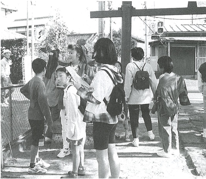
▲チェックポイントで鳥居の高さは何メートル？