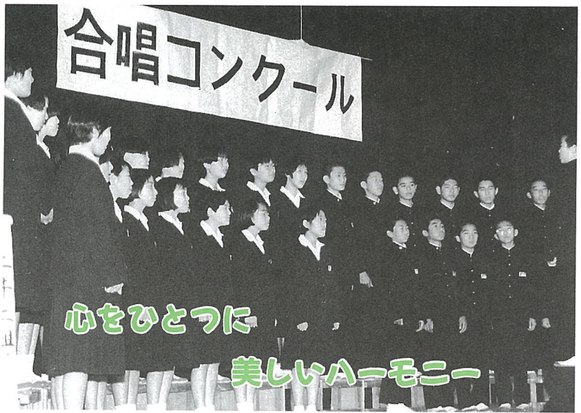
▲息の合った合唱に会場からは大きな拍手が沸き起こっていました。

最後の文化祭。委員長としてよくできたと思えます。これは努力してくれた全ての人のおかげです。協力してくれたみなさんありがとうございます。