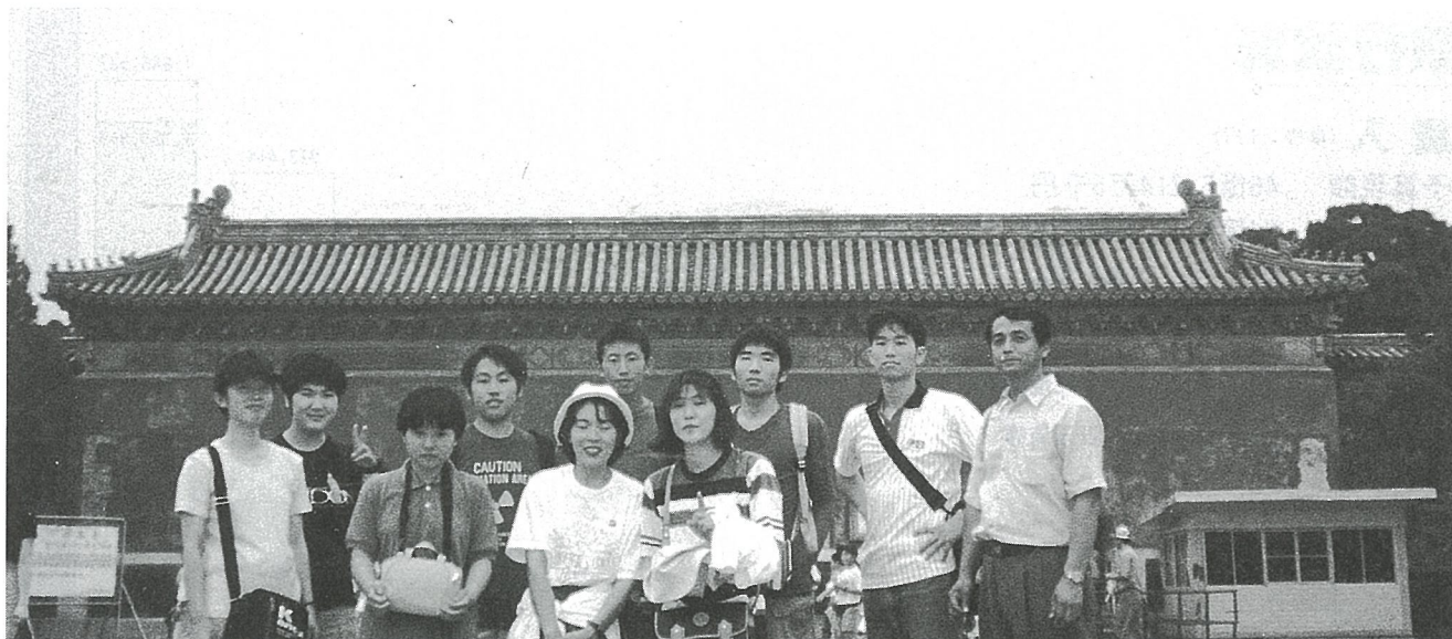
▲青少年海外視察研修に参加したみなさん。中国・明の十三陵前にて…。 21世紀の光町を担うため、大いに国際感覚を身につけてください。

からといって、足りない分を全額もらえるとは限らないことです。なぜなら、国が支出できる金額に限度があることはもちろんですが、地方交付税が必要となる全国の地方公共団体（市町村等）に不公平が生じないよう配分されるため、現実に地方公共団体が必要とする経費ではなく、国が定めた一定の基準により客観的に算定した経費を基に金額が決められるからです。