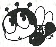
生涯学習のマスコット 「マナビイ」

女性のための祭典として始まったフォーラムが、「生涯学習」の一環として、すべてのみなさんを対象に行われ、たくさんの方が参加しました。