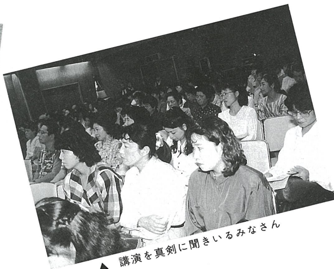
▲ 講演を真剣に聞きいるみなさん